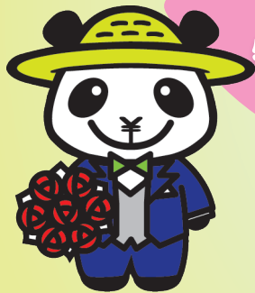
JAバンクえひめキャラクター ばんじゃくん