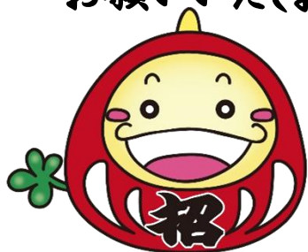
JA 松山市キャラクター まる芽ちゃん